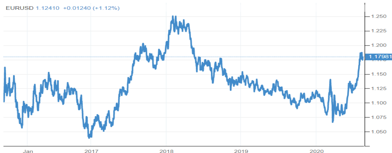
Pav. nr.3 Euro ir dolerio santykis per paskutinius 5 metus.

Taip pat praėjusi savaitė pasižymėjo itin teigiamą tendenciją įgavusiu euru. Euro sąjungos valiuta įgavo pranašumą prieš JAV dolerį visų pirma dėl gerai suvaldyto viruso problemų Europoje, o antra, Europos centrinis bankas pradėjo demonstruoti „neregėtus raumenis“ valdant kilusias paklausos ekonomikoje krizes aktyviai naudojant monetarinę politiką. Euro kaina JAV dolerio atžvilgiu priartėjo prie du metus nematyto 1,2 dolerio už eurą lygio.